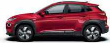
Pulse Red (Y2R)