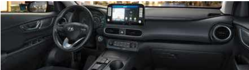
Μαύρο εσωτερικό TRY (standard)