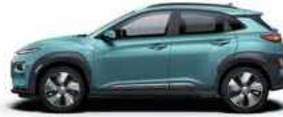
Ceramic Blue (SU8)