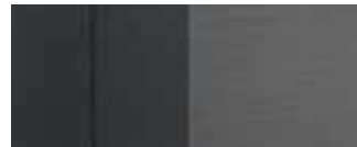
Υφασμάτινο μαύρο κάθισμα TRY