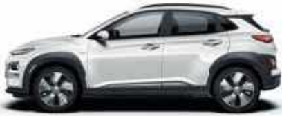
Chalk White (P6W)