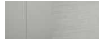
Δερμάτινο-υφασμάτινο γκρι κάθισμα SRX