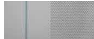
Δερμάτινο γκρι κάθισμα SRX