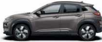
Galactic Grey (R3G)