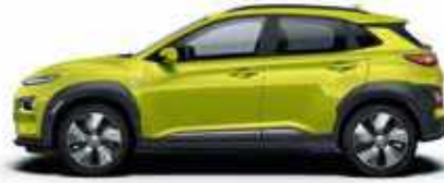
Acid Yellow (W9Y)