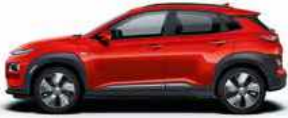
Tangerine Comet (TA9)