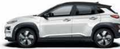
Chalk White με χρώμα οροφής Phantom Black

*Δεν διατίθενται όλα τα εξωτερικά χρώματα με όλα τα χρώματα οροφής