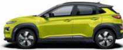
Acid Yellow με χρώμα οροφής Dark Knight