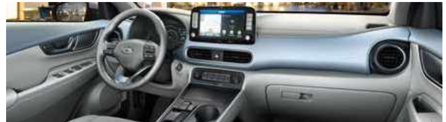
Τρίτο Γκρι-Μπλε εσωτερικό SRX (προαιρετικό, μόνο με επένδυση καθισμάτων δερμάτινη ή συνδυασμό δέρματος-υφάσματος, και μόνο σε συνδυασμό με τα εξωτερικά χρώματα Chalk White και Galactic Grey)