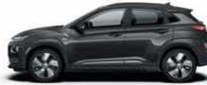
Dark Night (YG7)