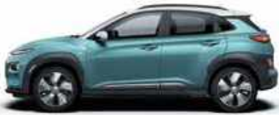
Ceramic Blue με χρώμα οροφής Chalk White