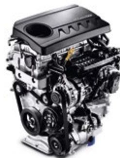
1.4 lt T-GDI με 140 ίππους