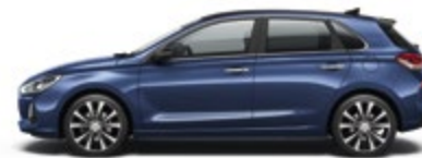
Stargazing Blue (SG5)