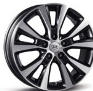
17" ζάντες αλουμινίου 5 διπλών ακτίνων 225/45R17