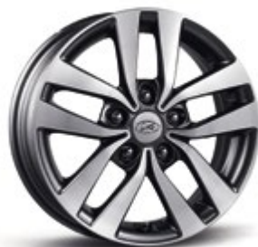
16" ζάντες αλουμινίου 5 διπλών ακτίνων 205/55R16