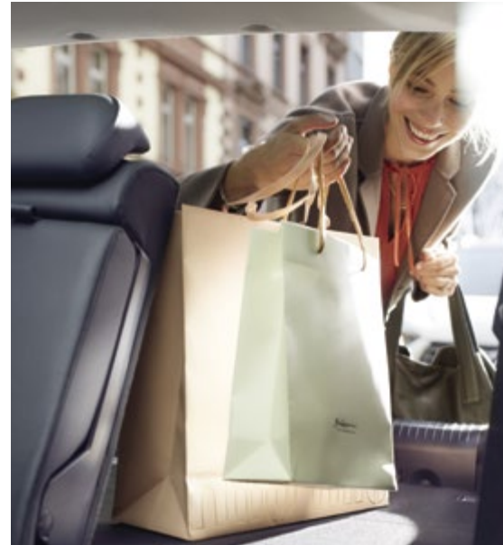
Ο χώρος αποσκευών από 395 έως 1301 λίτρα θα καλύψει κάθε σας ανάγκη