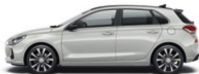
Platinum Silver (U3S)