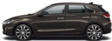
Moon Rock (XN3)