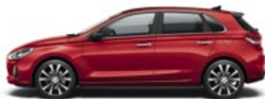
Engine Red (JHR)*