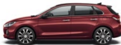
Fiery Red (PR2)