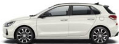
Polar White (PYW)*