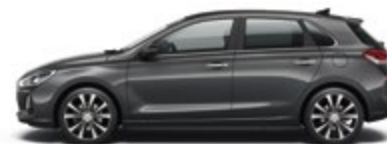
Micron Grey (Z3G)