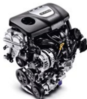
1.0 lt T-GDI με 120 ίππους