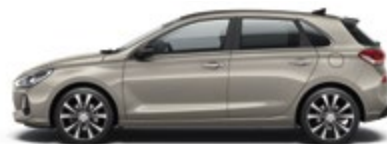
White Sand (Y3Y)