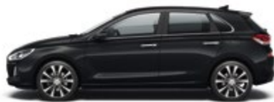
Phantom Black (PAE)