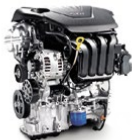
1.4 lt με 100 ίππους