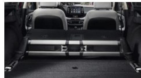
Σύστημα διαχείρισης χώρου αποσκευών