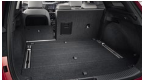
60/40 διαιρούμενα πίσω καθίσματα

Κάτω από την καλαίσθητη αεροδυναμική σχεδίασή του, το νέο i30 Tourer αποκαλύπτει έναν εντυπωσιακό χώρο 602 λίτρων για τις αποσκευές, που μπορεί να φθάσει τα 1.650 λίτρα με τα πίσω καθίσματα αναδιπλωμένα. Η ευελιξία αυτή καθιστά το i30 Tourer ιδανικό για οικογενειακές εξορμήσεις, εκδρομικές δραστηριότητες ή επαγγελματικούς σκοπούς. Σε οποιονδήποτε προορισμό κι αν σας οδηγεί η ημέρα, το i30 Tourer φροντίζει πάντα να φθάνετε με στυλ ...στον υπερθετικό βαθμό.