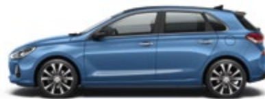
Ara Blue (R3U)