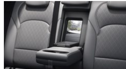
Πίσω υποβραχιόνιο με πρόσβαση ski-through στο χώρο αποσκευών