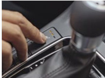
Θερμαινόμενα εμπρός καθίσματα (προαιρετικός εξοπλισμός)

Το άνετο εσωτερικό του χώρου επιβατών είναι από τα πλέον ευρύχωρα στην κατηγορία του ενώ η μεγάλη ανοιγόμενη πανοραμική ηλιοροφή ενισχύει την αίσθηση ελευθερίας. Τα καθίσματα με δέρμα και ύφασμα ολοκληρώνουν την εικόνα πολυτέλειας του νέου Hyundai i30.