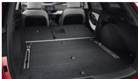
Ικανότητα αποθήκευσης ογκωδών αντικειμένων