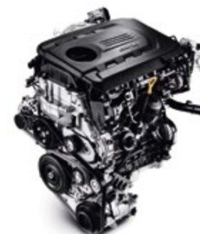
1.6 lt CRDI με 95/110/136 ίππους