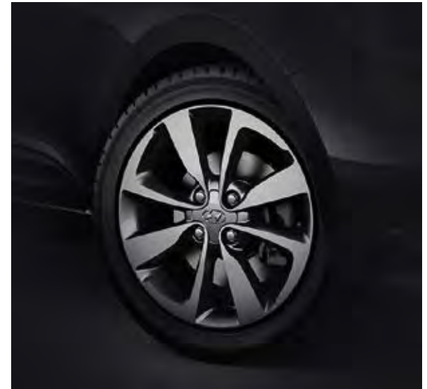
16" ζάντες αλουμινίου Busan.