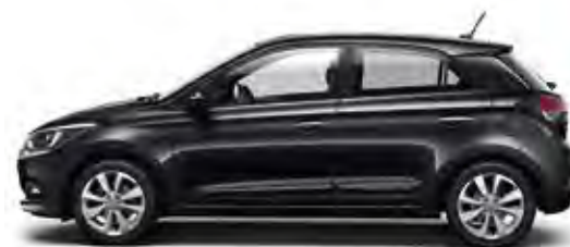
Phantom Black (X5B)