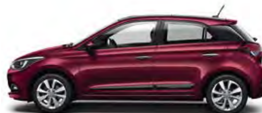
Red Passion (X2R)