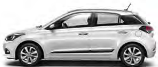
Polar White (PSW)*

Είμαστε όλοι διαφορετικοί, με διαφορετικές επιθυμίες και προτεραιότητες. Το νέο i20 διατίθεται σε μία ευρεία παλέτα χρωμάτων, που συνδυάζονται με εναλλακτικές εσωτερικές χρωματικές επενδύσεις. Έχουν δημιουργηθεί με απaráμιλλη προσοχή ώστε να έχουν αρμονική και καλαίσθητη συνύπαρξη, σε κάθε συνδυασμό. Στο τέλος, βάζετε την προσωπική σας πινελιά από την πληθώρα επιλογών σε αξεσουάρ, με τη συμβουλευτική συνδρομή του Επίσημου Εμπόρου Hyundai της περιοχής σας.