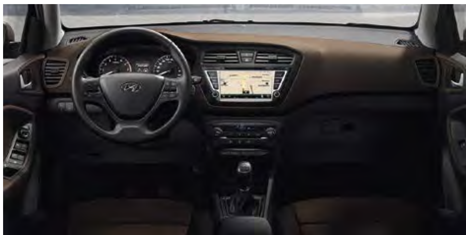
Εσωτερικό Brilliant Brown RBW (συνδυάζεται μόνο με εξωτερικά: X5B, X9N)