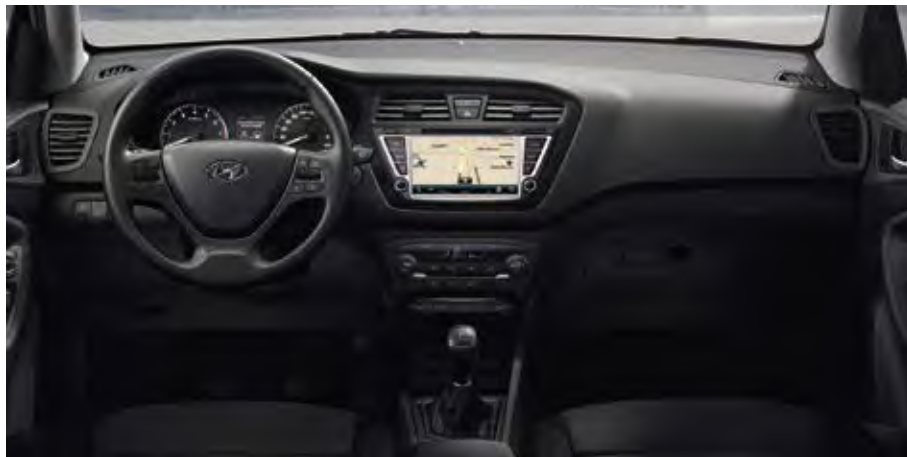
Εσωτερικό Comfort Gray TRX (συνδυάζεται μόνο με εξωτερικά: PSW, RYS, X2R)