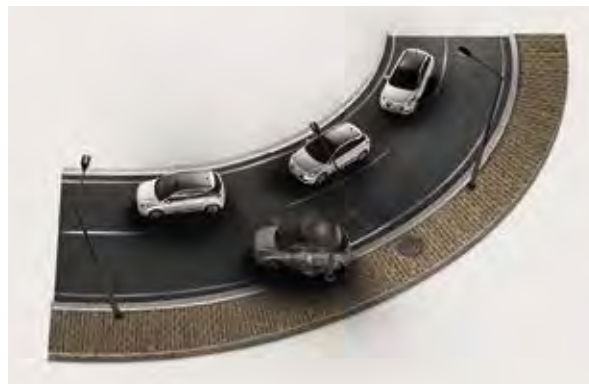
Ηλεκτρονικό σύστημα ελέγχου ευστάθειας. Λειτουργεί σε αρμονία με το σύστημα διεύθυνσης για να διατηρεί τη σταθερότητα και τον έλεγχο του οχήματος, ακόμα και σε συνθήκες χαμηλής πρόσφυσης όπως βρεγμένο οδόστρωμα, χιόνι, πάγος κ.ά. (Standard σε όλες τις εκδόσεις)