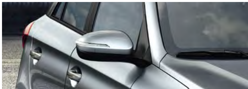
Ηλεκτρικά ρυθμιζόμενοι και θερμαινόμενοι εξωτερικοί καθρέπτες με ενσωματωμένο φλας.

Την έκδοση Connect συμπληρώνουν οι ηλεκτρικά ρυθμιζόμενοι και θερμαινόμενοι εξωτερικοί καθρέπτες με ενσωματωμένο φλας, το φως ανάγνωσης χάρτη με θήκη για γυαλιά και τα χειριστήρια ηχοσυστήματος στο τιμόνι.