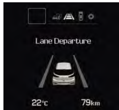
Σύστημα προειδοποίησης παρέκκλισης από τη λωρίδα κυκλοφορίας. Πρώτα οπτική και έπειτα ηχητική προειδοποίηση, όταν το όχημα παρεκκλίνει από τη λωρίδα κυκλοφορίας χωρίς φλας (Standard στην έκδοση Exclusive. Η απεικόνιση μπορεί να διαφέρει ανάλογα με την έκδοση).