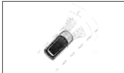
Hyundai SmartSense™ (LDW).

Πρόσθετες τεχνολογίες Hyundai SmartSense™ ενισχύουν την ασφάλειά σας με το Σύστημα Προειδοποίησης Εκτροπής Πορείας (LDW), το οποίο αναγνωρίζει τις λωρίδες στο δρόμο και ανιχνεύει εάν ο τροχός πλησιάσει το εσωτερικό της γραμμής λωρίδας χωρίς να έχει ανάψει σχετικό φλας – οπότε και ειδοποιεί με οπτικό και ηχητικό σήμα τον οδηγό, καθώς επίκειται πιθανή ακούσια αλλαγή λωρίδας. Παράλληλα ο Περιοριστής Ταχύτητας (Speed Limiter) σας δίνει τη δυνατότητα να επιλέξετε εκ των προτέρων το ανώτατο όριο ταχύτητας ώστε να κινηθείτε με ασφάλεια σε μεγάλα ταξίδια.