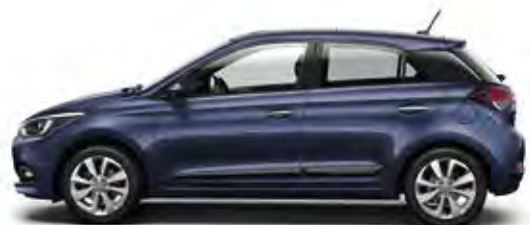
Morning Glory (X3U)*