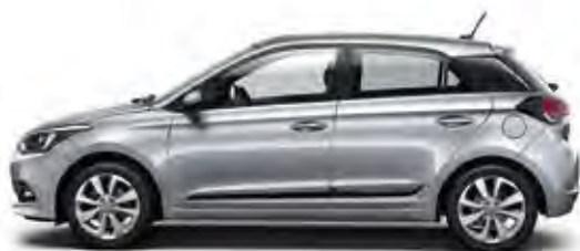
Sleek Silver (RYS)