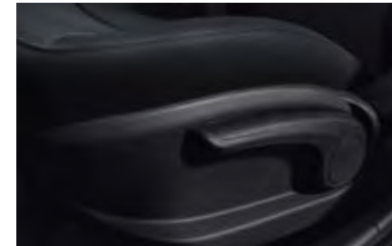
Κάθισμα οδηγού ρυθμιζόμενο καθ' ύψος. Βελτιστοποιήστε τη θέση οδήγησής σας, ρυθμίζοντας το κάθισμα στα μέτρα σας.