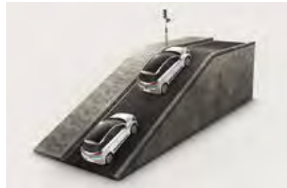
Σύστημα υποβοήθησης εκκίνησης σε ανηφόρα. Δεν αφήνει το αυτοκίνητο να κυλήσει προς τα πίσω κατά την εκκίνηση σε ανηφόρα. (Standard σε όλες τις εκδόσεις)

Ο στάνταρ εξοπλισμός παρέχει καθημερινή άνεση με εμπρόσθια ηλεκτρικά παράθυρα, κεντρικό κλείδωμα, air condition, κάθισμα οδηγού με ρυθμιζόμενο ύψος, ραδιόφωνο με θύρες σύνδεσης USB και AUX-IN. Στάνταρ επίσης παρέχονται οι εξοπλισμοί ασφαλείας με 6 αερόσακους, σύστημα υποβοήθησης εκκίνησης σε ανηφόρα και το προηγμένο σύστημα VSM (Vehicle Stability Management) που συνδυάζει το ESP με την ηλεκτρική υποβοήθηση τιμονιού (βλέπε σελίδα 10).