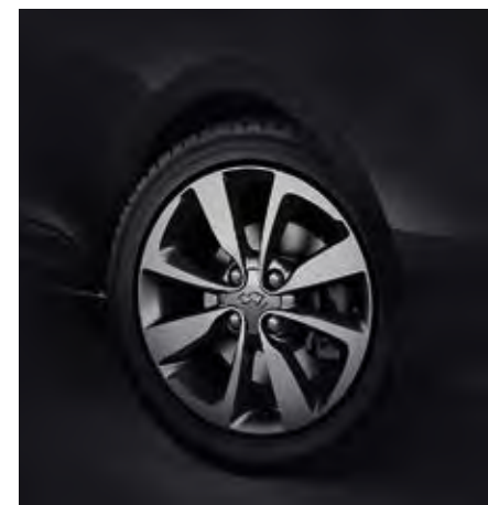
Ζάντες Αλουμινίου 16"