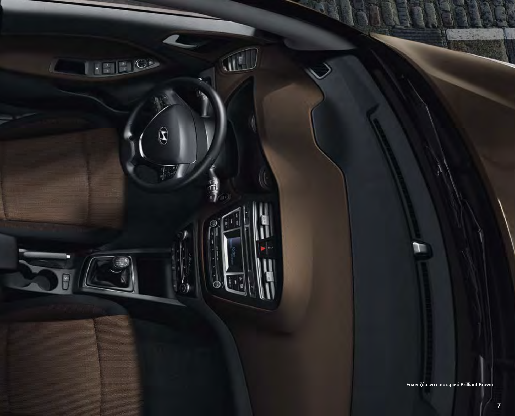
Εικονιζόμενο εσωτερικό Brilliant Brown