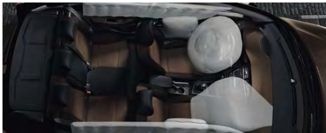
6 αερόσακοι. Απόλυτη προστασία με 6 αερόσακους: 2 μετωπικούς, 2 πλευρικούς και 2 τύπου κουρτίνας. (Standard σε όλες τις εκδόσεις)

Η δομή του αμαξώματος του νέου i20 αποτελείται από 42% χάλυβα υπέρ-υψηλής αντοχής, προσφέροντας ενισχυμένη στρεπτική ακαμψία κατά 81%. Το νέο i20 προσφέρει μία σειρά από έξυπνες δυνατότητες: σύστημα προειδοποίησης παρέκκλισης από τη λωρίδα κυκλοφορίας, σύστημα παρακολούθησης πίεσης ελαστικών και έξυπνη συνεργασία υποβοήθησης τιμονιού με ESP (VSM).