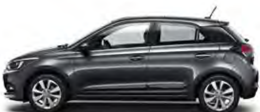
Star Dust (V3G)