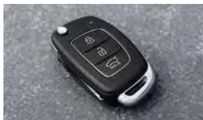
Τηλεχειρισμός κλειδώματος και ξεκλειδώματος. Μπορείτε να κλειδώνετε και να ξεκλειδώνετε τις θύρες και τον χώρο αποσκευών με τα κουμπιά του κλειδιού.