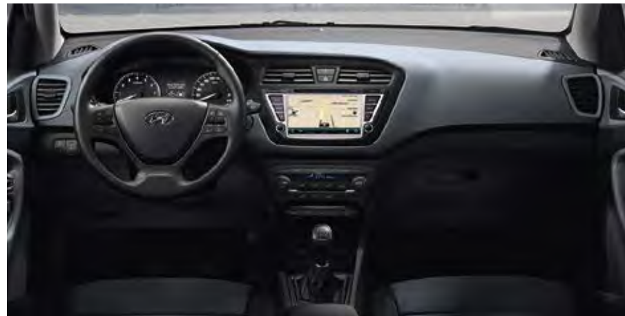
Εσωτερικό Grayish Blue UGY (συνδυάζεται μόνο με εξωτερικά: V3G, W3U, X3U)