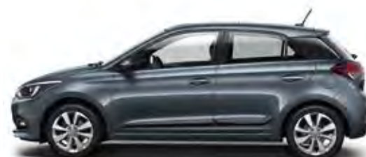
Aqua Sparkling (W3U)