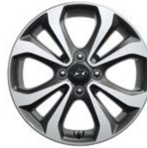
Ζάντα αλουμινίου 15" 4 διπλών ακτίνων