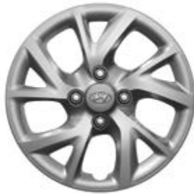
Κάλυμμα τροχών 14" 5 διπλών ακτίνων