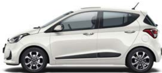
Polar White* (PSW)

Είμαστε όλοι διαφορετικοί, με διαφορετικές επιθυμίες και προτεραιότητες. Το νέο i10 διατίθεται σε μία ευρεία παλέτα χρωμάτων, που συνδυάζονται με εναλλακτικές εσωτερικές χρωματικές επενδύσεις. Έχουν δημιουργηθεί με απaráμιλλη προσοχή ώστε να έχουν αρμονική και καλαίσθητη συνύπαρξη, σε κάθε συνδυασμό. Τελευταία, η προσωπική σας πινελιά από τις επιλογές αξεσουάρ που μπορείτε να επιλέξετε, με τη συμβουλευτική συνδρομή του Επισήμου Εμπόρου Hyundai της περιοχής σας.