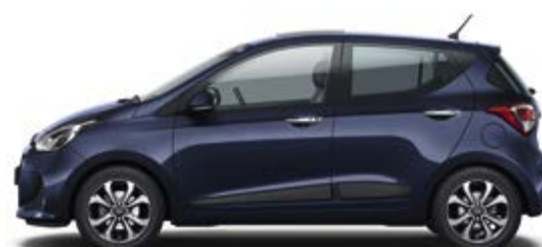
Morning Blue* (X3U)