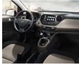
Black & Beige (YBE) Συνδυάζεται με τα χρώματα αμαξώματος X9N και X5B.