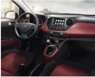
Black & Red (MRE) Ειδική παραγγελία