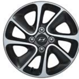
Ζάντα αλουμινίου 14" 8 ακτίνων