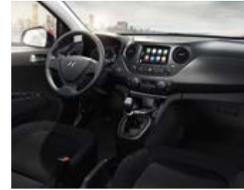
Black & Dark Grey (TMT) Συνδυάζεται με τα χρώματα αμαξώματος PSW, RYS, V3G και X2R