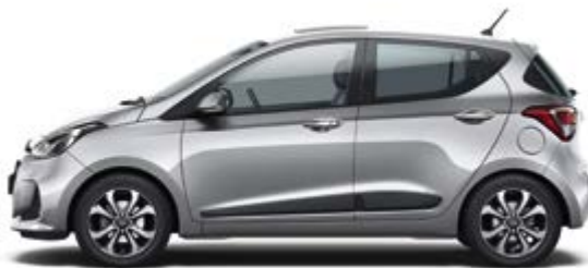
Sleek Silver (RYS)