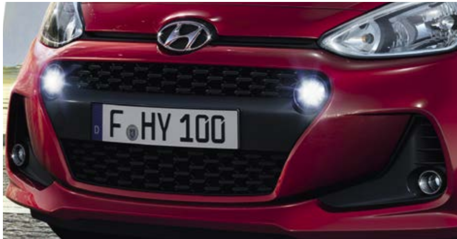
Νέα Μάσκα. Η ανάγλυφη υφή της νέας μάσκας τονίζει τον γεμάτο αυτοπεποίθηση χαρακτήρα του νέου i10.

Στο καθιερωμένο σχήμα του i10 έχει δοθεί ένας νέος σπορ χαρακτήρας που μαγνητίζει τα βλέμματα. Η νέα πρόσθια μάσκα εμπνέεται από τη ροή του καυτού χάλυβα λίγο πριν πάρει τη μορφή του αυτοκινήτου και ενσωματώνει αρμονικά τα νέας σχεδίασης φώτα ημέρας LED. Τα νέα σχέδια των τροχών και ο νέος πίσω προφυλακτήρας, που δημιουργεί οπτικές αντιθέσεις με τα ανασχεδιασμένα πίσω φωτιστικά σώματα, συμπληρώνουν μία εικόνα νεανική όσο και στιβαρή.