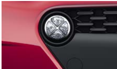
Φώτα ημέρας LED. Τα νέας σχεδίασης πλαίσια των φώτων ημέρας LED προσθέτουν ένα ξεχωριστό σπορ χαρακτήρα στην πρόσθια εμφάνιση του i10.