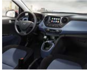
Black & Blue (MBX) Συνδυάζεται με τα χρώματα αμαξώματος W3U και X3U