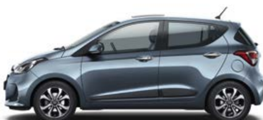
Aqua Sparkling (W3U)