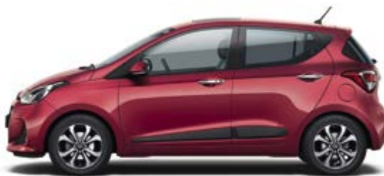
Passion Red (X2R)