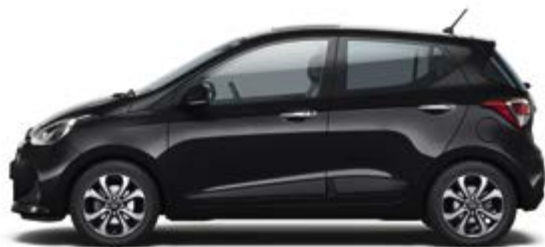
Phantom Black (X5B)