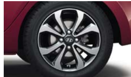
Νέα σχέδια τροχών. Ανάλογα με το επίπεδο εξοπλισμού διατίθενται διαφορετικής σχεδίασης τροχοί που ολοκληρώνουν την σπορ εικόνα του i10.