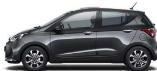
Star Dust (V3G)